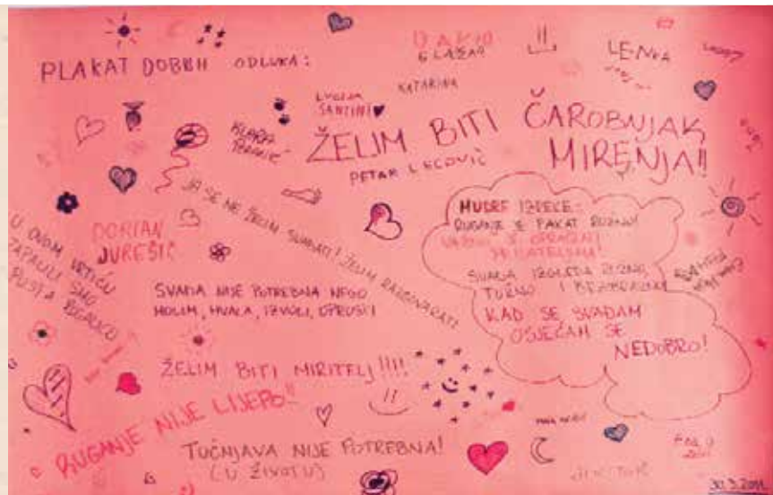
Plakat dobrih odluka (2011.)

Svečano potpisivanje Plakata dobrih odluka u školi