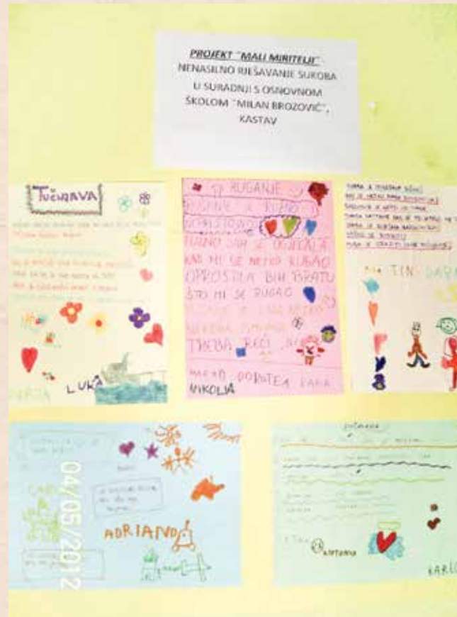
O negativnim oblicima ponašanja i osjećajima vezanim uz njih