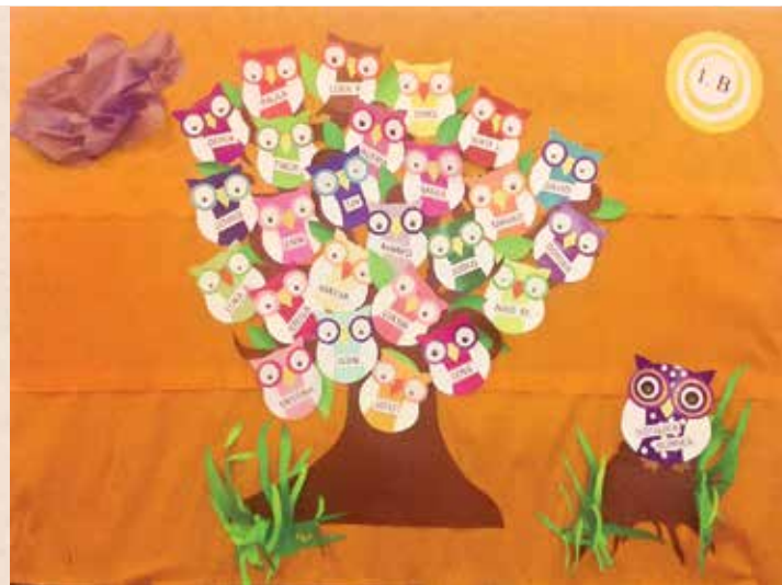
Slika 9. Drvo mira u školi