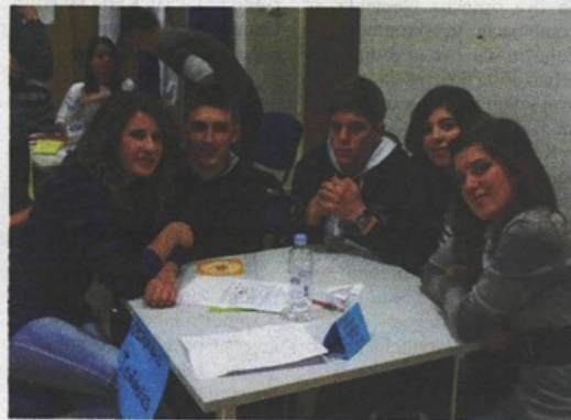
Ekipa iz Srednje škole Obrovac