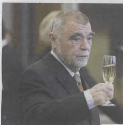
To je bila politička poruka - Stjepan Mesić