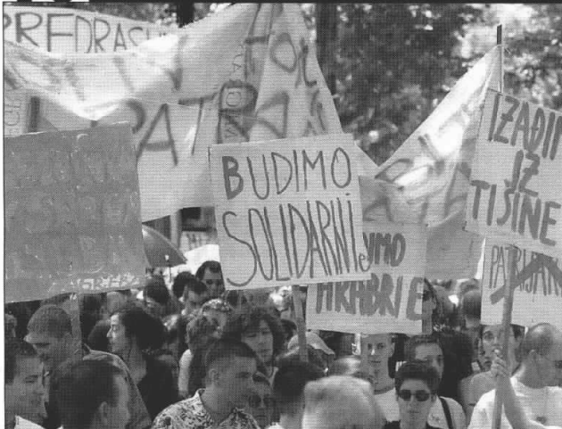
Usvajanje antidiskriminacijskog zakona za sobom bi automatski povuklo trajno degaziranje "Grazdova" nazadnog nauka iz hrvatskog obrazovnog sistema prizor sa zagrebačkog Gay-pridea